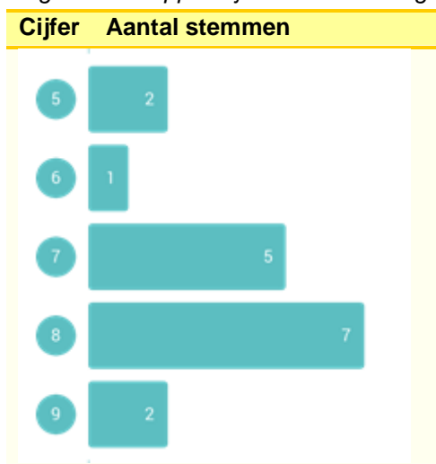
Figuur 4.1 Rapportcijfers voor de veiligheid van de buurt

Slechts twee van de 17 personen die hun stem hebben doorgegeven oordeelden dat de veiligheid in de buurt onvoldoende is. In dit kader ging het met name over gezondheidsveiligheid (bijvoorbeeld door de uitstoot van uitlaatgassen) en verkeersveiligheid. Bijna 90 procent van de aanwezigen heeft de veiligheid in de buurt met een voldoende beoordeeld. Het gemiddelde cijfer van de deelnemers was een 7,4.